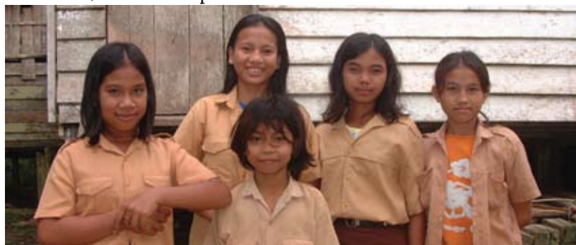
Escuela de Niñas en Menyumbang, Indonesia - J. Foale - Pasionistas Internacional