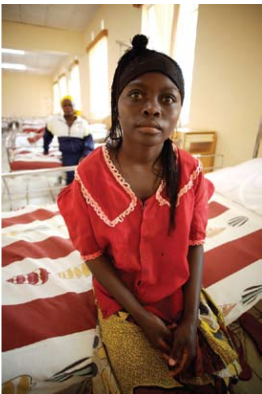
Paciente en el Hospital Panzi