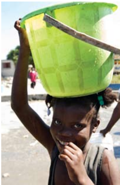
Una chica en el barrio de chabolas de Cité Soleil, Haití, cerca de Port-au-Prince, sonrío después de haber luchado por un cubo de agua.

--Anita L. Wenden Presidenta, NGOCSW/NY Subcomité sobre la Mujer